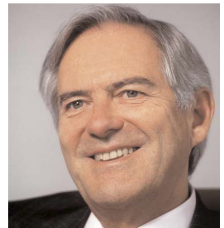
Roland Berger gründete seine Stiftung im März 2008 mit einem Kapital von 50 Millionen Euro aus seinem persönlichen Vermögen.