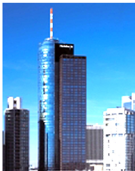
Domizil mit Symbolkraft: Helaba- MAIN TOWER in Frankfurt

Ermahnung: Auf den Ergebnissen dürfe man sich keinesfalls ausruhen. Jetzt müsse der Bankenmarkt in Deutschland nachhaltig gefestigt werden. Eigentümer und Aufsicht müssten sich ihrer Verantwortung bewusst sein. Insbesondere der Landesbankensektor bedürfe dabei einer Konsolidierung und Neuausrichtung. Beispiel Helaba: Eine Ermahnung, die sicher auch für sie gilt. Trotz aller berechtigten Zufriedenheit, denn die Landesbank Hessen-Thüringen – Helaba – hat den vom CEBS koordinierten europaweiten Stresstest für 91 Kreditinstitute, wie zwölf andere